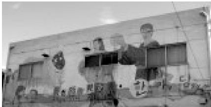
青い壁に農楽の絵がある建物です